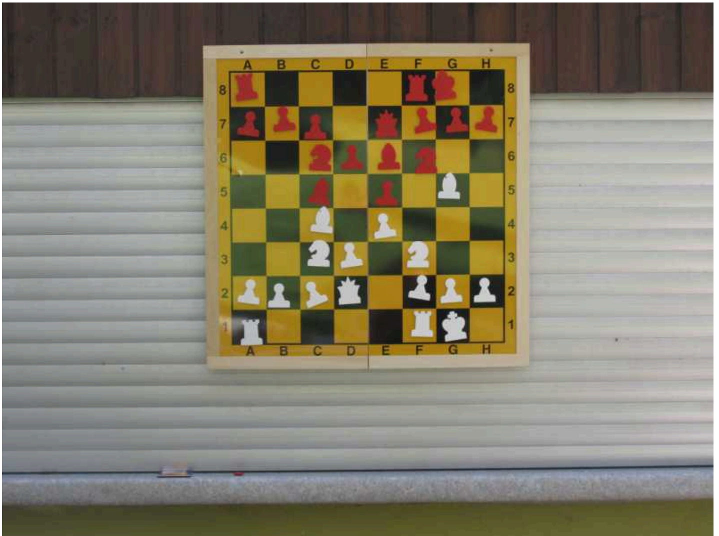
wie auch unser neues Demobrett als Erklärungshilfe.