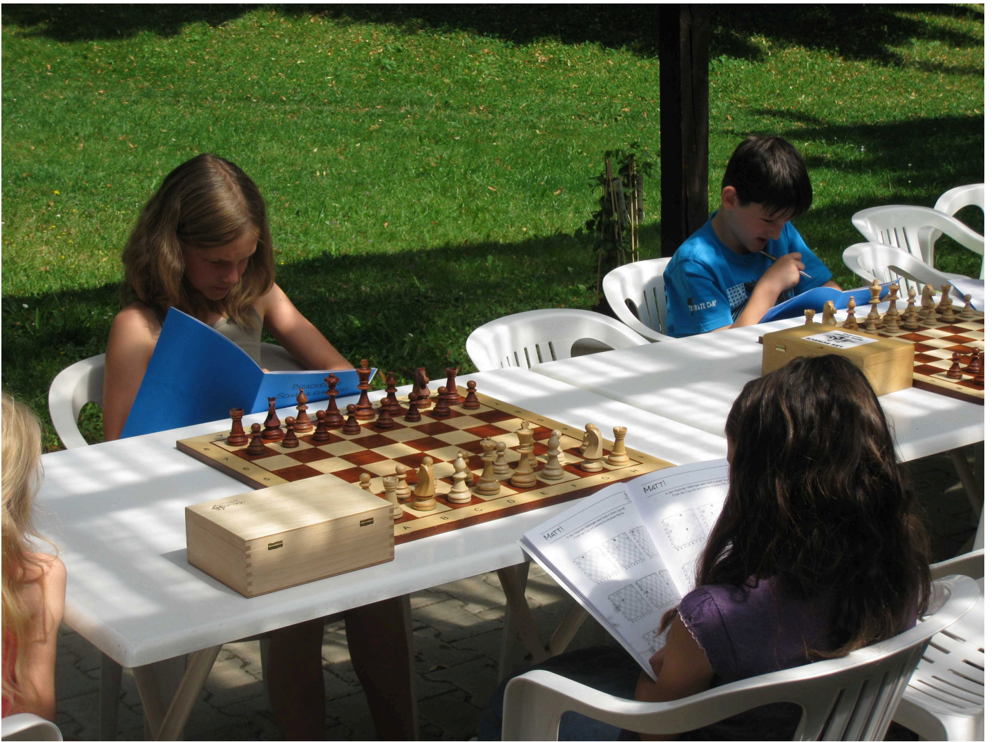
Nachdem auch die letzten Aufgaben gelöst waren,