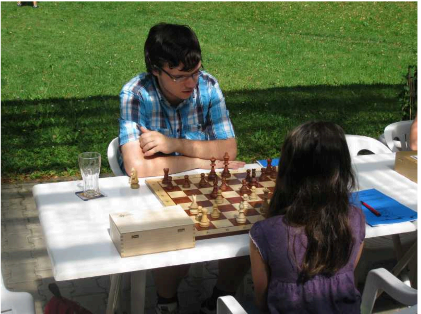
oder gleich versuchte seinen Trainer zu besiegen.