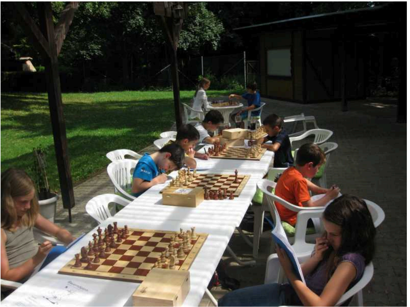
An den hier gezeigten Aufgaben musste manch einer doch etwas knabbern...