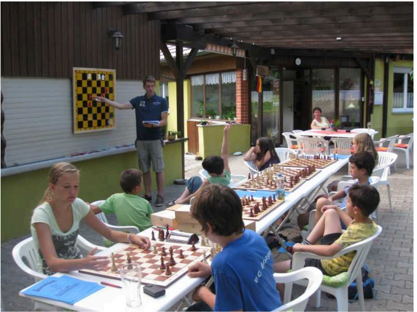
Ab und zu schritt aber auch er zum Demobrett um die Teilnehmer auf den Weg in Richtung Bauerndiplom zu bringen.