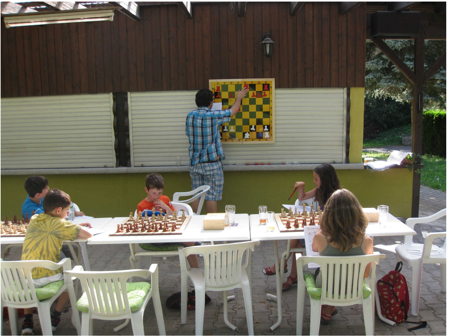
Hilfreicher war es da hoffentlich doch meinen Erklärungen zuzuhören...